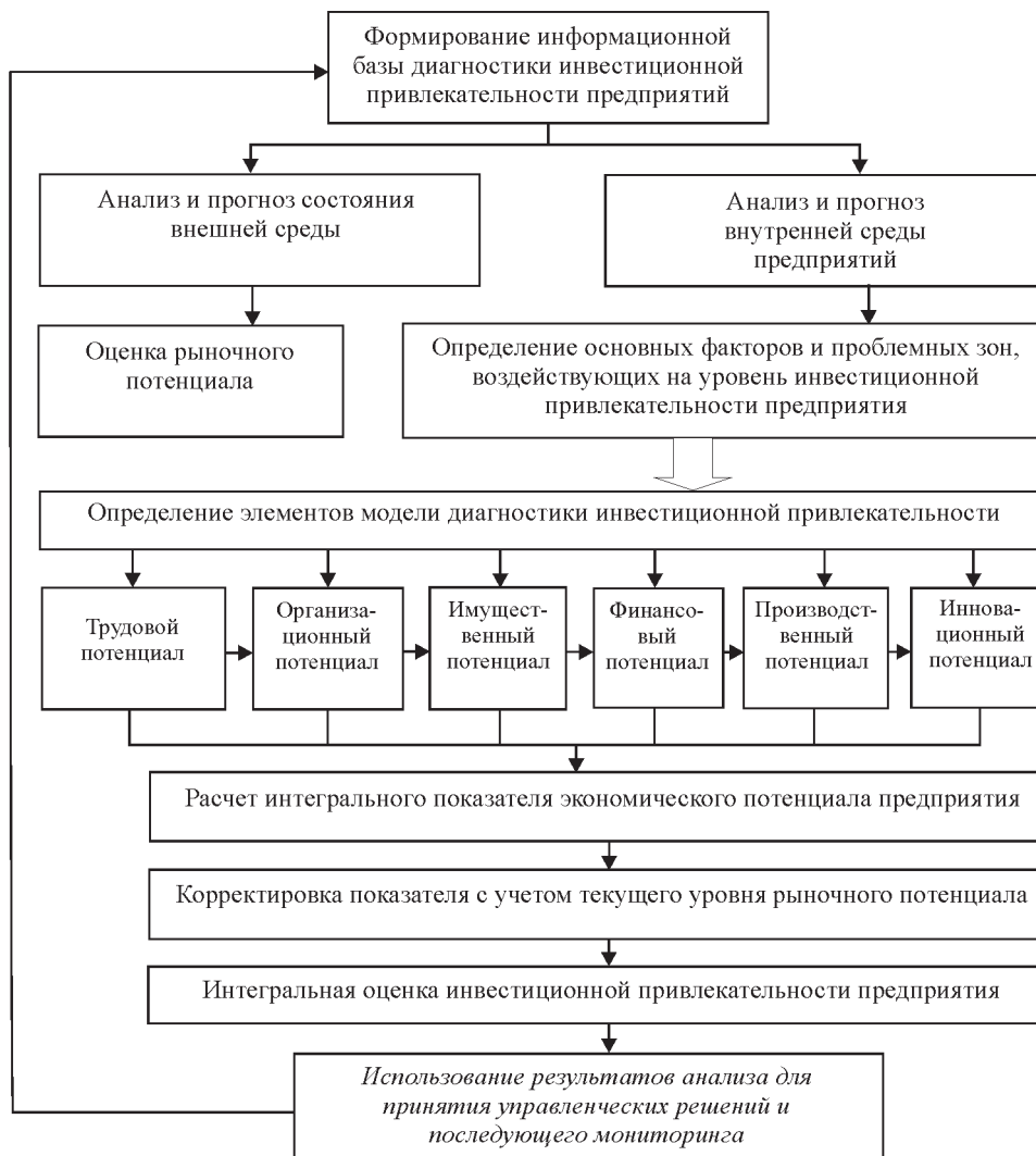
Рис. 4. Модель диагностики инвестиционной привлекательности промышленного предприятия

– динамичность показателя инвестиционной привлекательности предприятия вследствие динамичности определяющих его факторов;