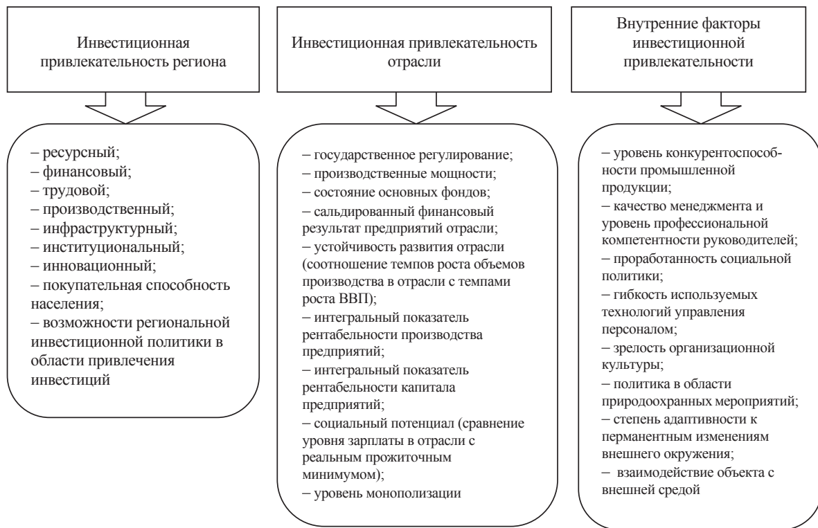
Рис. 1. Систематизация факторов инвестиционной привлекательности хозяйствующего субъекта в сфере промышленности

количественной оценки, так как зависят от субъективного мнения экспертов.