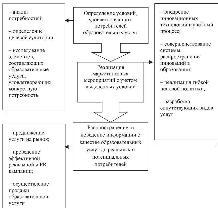
Рис. 2. Роль маркетингового инструментария в формировании ценности образовательной услуги (авторская разработка)

Опираясь на изложенное выше, можно схематически представить формирование ценности образовательной услуги с использованием инструментов маркетинга для устранения недостатков, связанных с отдельными характеристиками образовательной услуги (рис. 2).