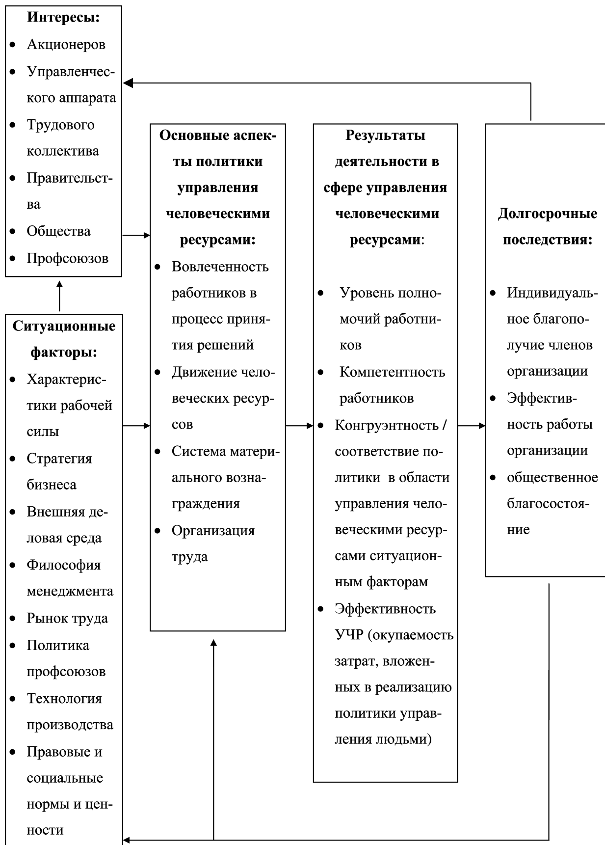
Рис. 1. Гарвардская модель управления человеческими ресурсами [3, с. 16]