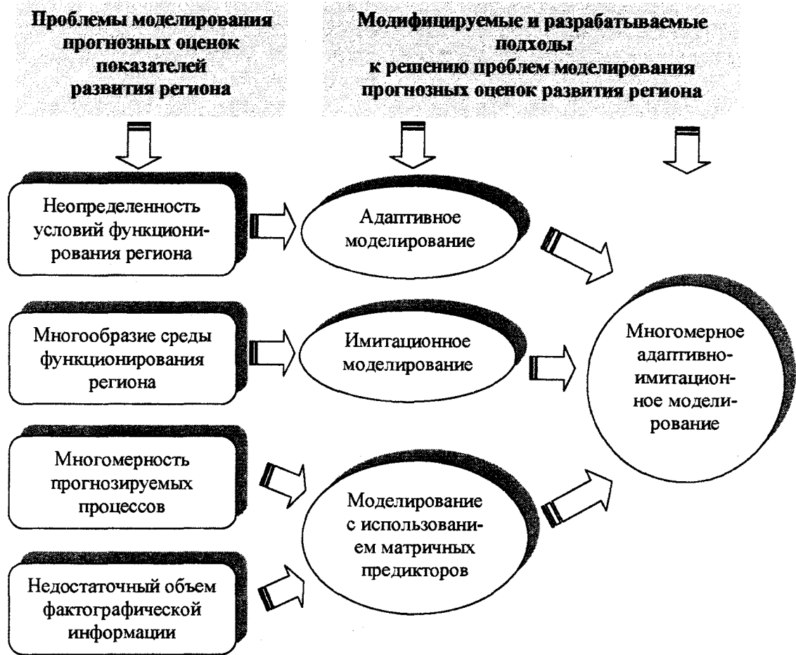
Рис. 2. Схема разработки комбинированного метода прогнозирования социально-экономического развития региона

но, эта характеристика должна быть ключевой и в самой прогнозной модели многомерных процессов. Учитывая возможность проведения экстраполяционных расчетов для многомерных временных рядов, будем рассматривать в качестве измерителя взаимосвязи косвенный темп прироста. Ключевая идея этой гипотезы в том, что на протяжении некоторого периода времени структура косвенных темпов приростов прогнозируемых показателей может оставаться почти неизменной.