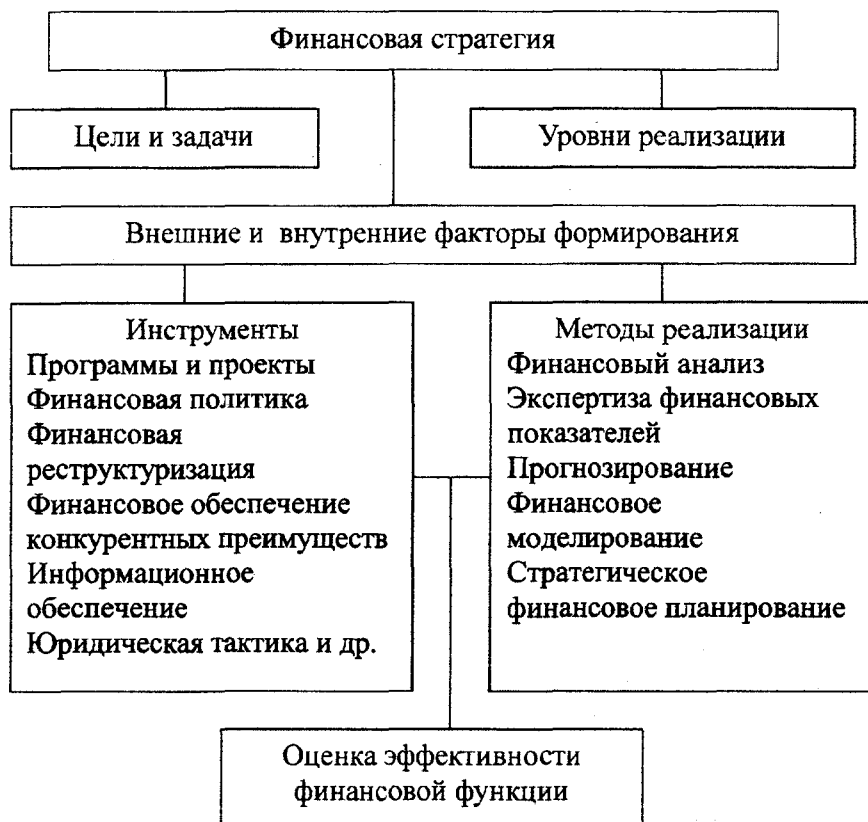
Рис. 4. Модель организации финансовой функции промышленного предприятия

При аналитическом рассмотрении ряда исследований [12, 14, 15] наглядным становится тот факт, что наиболее существенным детерминантом эффективного развития финансового управления хозяйствующего субъекта является наличие гибкого и адаптированного механизма финансового планирования, содержащего две