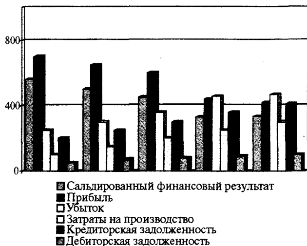
Рис. 3. Динамика финансовых результатов деятельности предприятий машиностроительного комплекса Воронежской области в период с 2002 по 2005 гг.