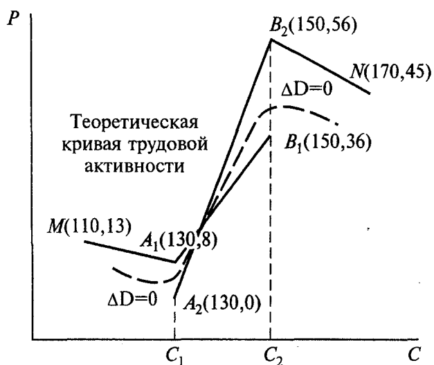
Рис. 2. Статистическая зависимость трудовой активности ( P ) от уровня удельного вознаграждения труда ( C ).

шения эффективности производства. Важнейший фактор такого повышения — разработка действенных систем стимулирования трудовой активности первичных коллективов и отдельных работников. А для этого необходимо знать не только вид, но и статистические параметры зависимости результатов труда от характера и интенсивности его вознаграждения. Поскольку организаторы обследования машиностроителей ставили перед собой несколько иную задачу, в процессе анализа указанных данных был сделан ряд правдоподобных предположений.