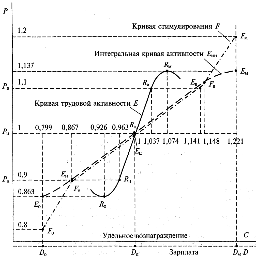
Рис. 4. Влияние вознаграждения на трудовую активность и обобщенный результат труда

каждом (точнее, — по 14 %). То есть полагаем, что ситуации правее R_м и левее R_0 реализуются весьма редко (см. рис. 4).