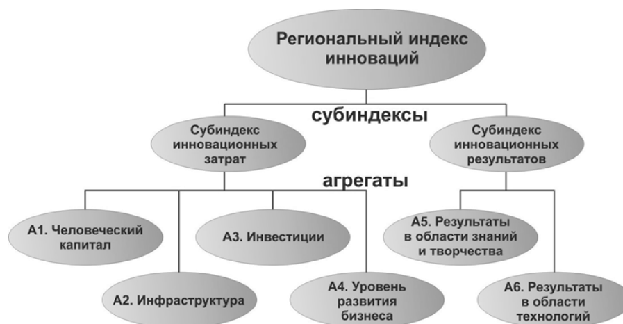
Рис. 2. Схема построения Регионального индекса инноваций

РИИ строится как среднее арифметическое двух субиндексов – инновационных затрат и инновационных результатов. Первый описывает элементы региональной экономики, которые способствуют инновационной активности. Субиндекс инновационных результатов учитывает итоги инновационной активности, т.е. тот «выход», который получается в результате осуществления инновационных затрат.