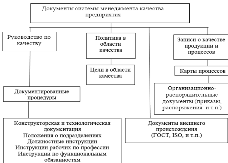
Рис. 1. Структура источников информации, используемой для проведения маркетингового исследования в области СМК предприятий

Как видим из рисунка, одним из важнейших элементов информационной базы маркетингового исследования СМК предприятий выступают карты процессов, что обусловлено современными тенденциями построения систем управления качеством. Сегодня большинство существующих систем менеджмента качества хозяйствующих субъектов создаются и поддерживаются в рабочем состоянии на основе процессно-ориентированного подхода в