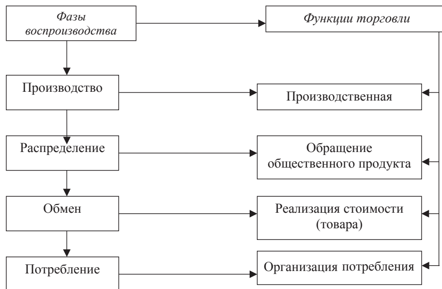
Рис. 1. Функции торговли с позиций теории воспроизводства

С точки зрения экономической теории распределение, обмен и потребление сущности производства не представляют, ибо, сколько бы общество ни обменивалось продуктами труда и деятельности, сколько бы ни распределяло средства и продукты производства, никакой потребительной стоимости при этом не создается. Относящиеся к производству процессы распределения, обмена и потребления играют по отношению к нему формальную, но не содержательную роль.