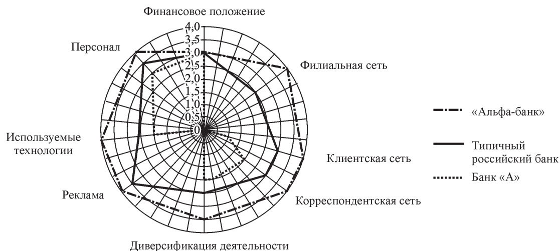
Рис. 2. Профили типичного российского банка, «Альфа-банка» и банка «А»

ской деятельности для оценки конкурентоспособности банков на национальном рынке. Необходимость корректировки вызвана тем, что направления, определенные в методике И. В. Рабиновича, позволяют оценить конкурентные преимущества крупных российских банков, нацеленных на ведение бизнеса не только в России, но и за рубежом, что, в свою очередь, исключает возможность оценки конкурентных преимуществ мелких региональных банков. Результаты проведенного анализа, представленные на рис. 2, свидетельствуют о том, что ОАО «Альфа-банк» обладает высокими конкурентными преимуществами, чего нельзя сказать о банке «А». Большинство показателей доказывают, что конкурентоспособность банка «А» значительно ниже, чем у ОАО «Альфа-банк» и типичного российского банка. В условиях конкурентной среды возможность выжить и привлекать клиентов является для данного банка проблематичной, и ему следует уделить внимание наращиванию конкурентных преимуществ.