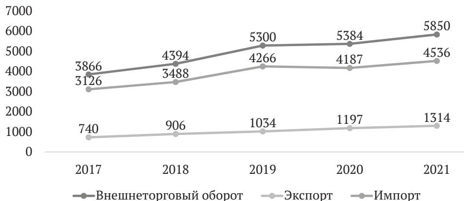
Рис. 1. Динамика торгово-экономического сотрудничества Китая и Республики Беларусь за 2017–2021 гг., млн долл. США

Данные рис. 1 свидетельствуют, что общий внешнеторговый оборот на конец 2021 г. составил 5850 млн долл. США, что значительно выше