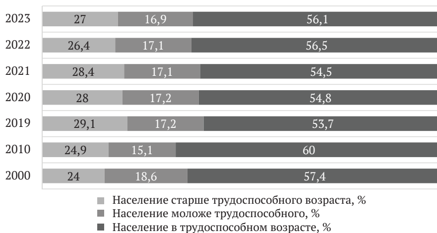
Рис. 2. Возрастная структура населения Липецкой области, 2000–2023 гг., на начало года, %