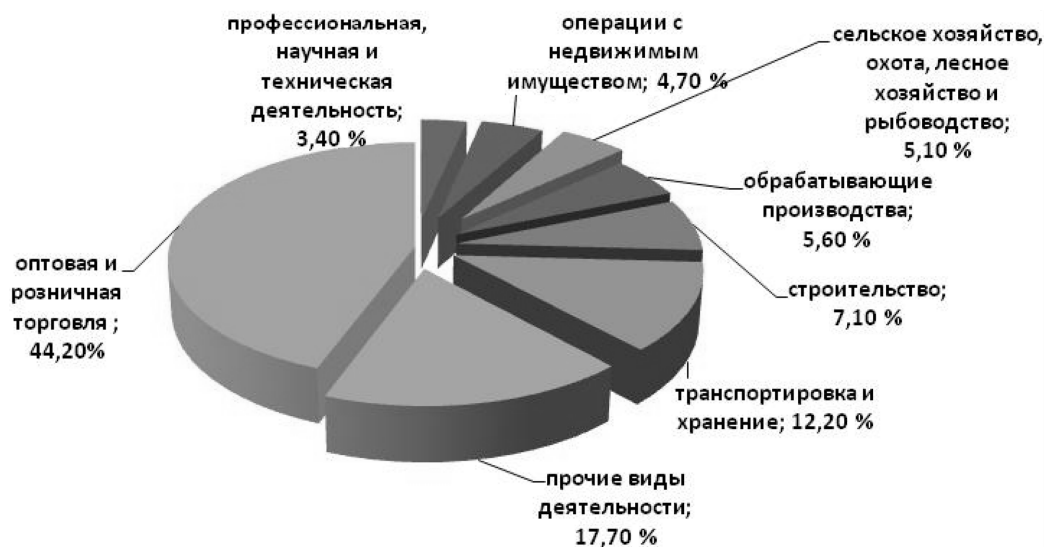
Рис. 2. Распределение субъектов малого и среднего бизнеса области по видам экономической деятельности