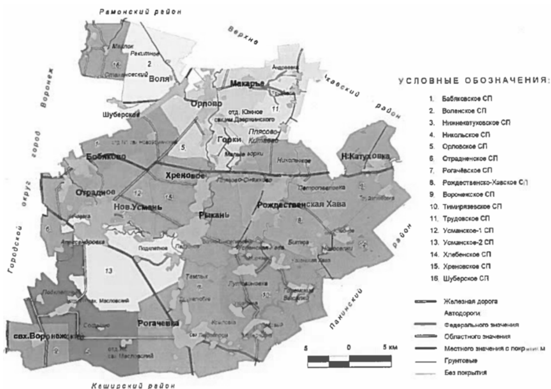
Рис. 2. Сетка муниципально-территориального деления Новоусманского муниципального района

Первые резиденты появятся в ОЭЗ уже в 2020 г. ООО «Ламплекс композит» расположится на площадях Индустриального парка «Масловский». О намерениях реализовать на территории «Центра» инвестпроекты на общую сумму 3,5 млрд руб. уже заявили 6 компаний. Ожидается, что к 2028 г. объем инвестиций потенциальных резидентов ОЭЗ составит более 9 млрд руб, а количество созданных рабочих мест достигнет почти 1500 тысяч. Объем выручки потенциальных резидентов от продажи товаров, работ, услуг превысит 75 млрд руб., а совокупный объем налоговых и таможенных платежей в бюджеты всех уровней от ОЭЗ «Центр» – более 12 млрд руб. [4].