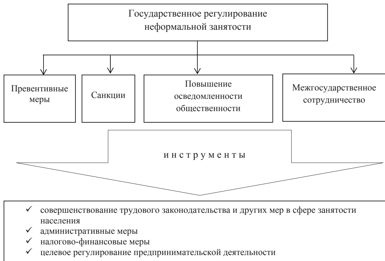
Рис. 1. Базисные направления современного государственного регулирования неформальной занятости

Что касается ограничений – санкций, – то они сводятся к увеличению штрафов за нарушение трудового и налогового законодательства, расширению полномочий контрольных органов (например, государственной инспекции труда или налоговой инспекции), включая проведение внеплановых проверок организаций, введению обязательного единого идентификационного номера и т. д. Таким образом, санкции основываются на укреплении надзорной функции государства, улучшении координации и взаимодействия между соответствующими государственными органами и ведомствами и направлены против тех работодателей и работников, которые извлекают выгоду из неформальной занятости.