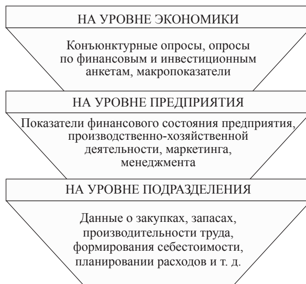
Рис. 1. Компоненты финансового мониторинга

Принято выделять три основных компонента финансового мониторинга, реализуемого на разных уровнях управления: на уровне структурных подразделений хозяйствующих субъектов, предприятия в целом и уровне экономики [14]. Данные о финансовых процессах, генерируемые на данных уровнях, представлены на рис. 1.