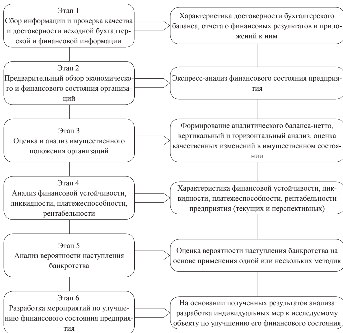
Рис. 2. Этапы проведения мониторинга финансового состояния предприятия

В процессе мониторинга финансового состояния предприятий принято выделять шесть основных этапов (рис. 2).