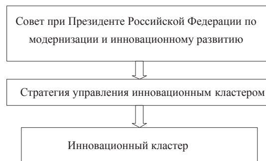
Рис. 1. Стратегия управления инновационным кластером

Инициатива формирования стратегии управления инновационными кластерами должна исходить от государства (рис. 1). Это связано в первую очередь с необходимостью выстраивания единой политики управления инновационными кластерами на территории Российской Федерации. При формировании стратегии следует учитывать внешние и внутренние факторы, которые влияют на инновационный кластер. Только при этом условии возможно достижение поставленной цели. На рис. 2 представлены одни их наиболее значимых. К примеру,