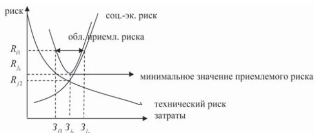
Рис. 1. Определения области приемлемого риска и его минимального значения

Предложена обобщенная схема определения области приемлемого риска и его минимального значения, представленная на рис. 1.