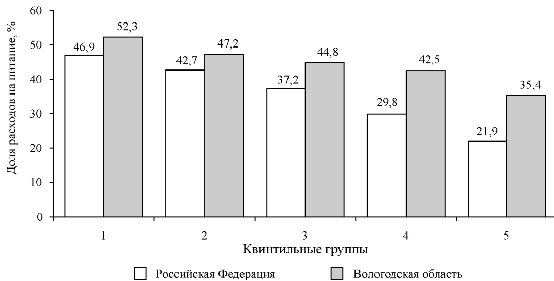
Рис. 2. Доля расходов на питание в структуре потребительских расходов населения Российской Федерации и Вологодской области в 2009 году

ловину потребительских расходов. В странах с развитой рыночной экономикой удельный вес расходов на питание в США составляет 10 %, Японии – 15 %, Швеции – 16 %, в России – 30 %. В Вологодской области доля расходов на питание составляет около 38 % потребительских расходов населения, для нее характерна тенденция снижения: в 2000 г. расходы на питание составляли половину потребительского бюджета. Однако население региона неоднородно по уровню дохода, в результате чего и доля расходов на питание неодинакова в разрезе доходных групп (рис. 2). В Вологодской области по правилу Энгеля к бедным людям следует отнести представителей двух нижних доходных групп с удельным весом расходов на питание 52 % и 47 %. Доля бедных составляет примерно 37–38 % населения региона, как при использовании субъективной оценки.