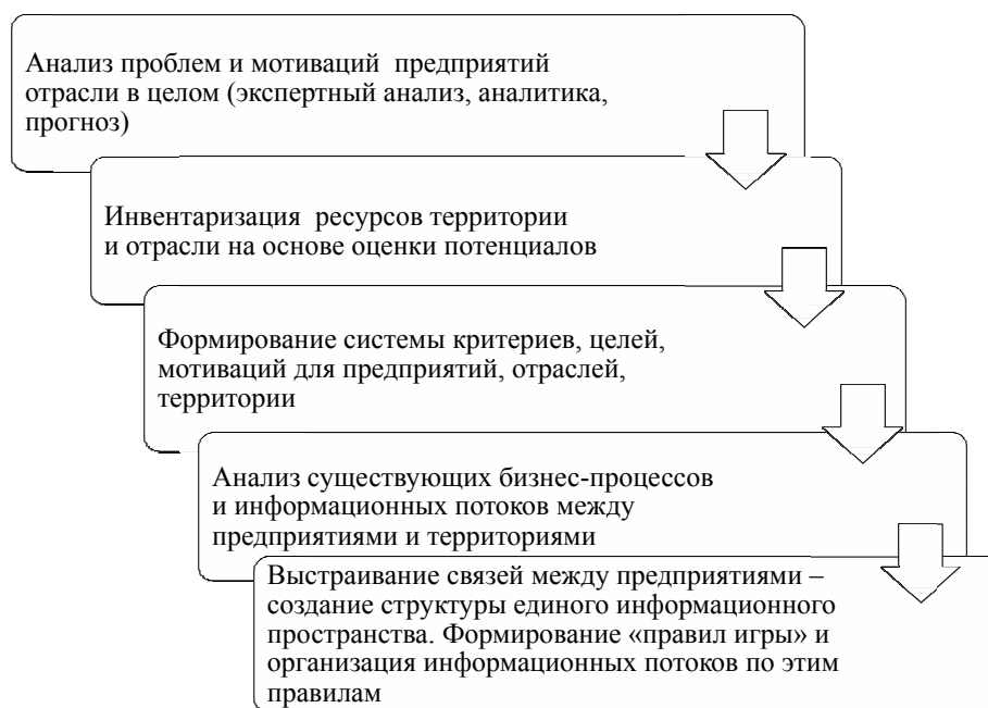
Рис. 5. Ступенчатый процесс разработки SRP проекта