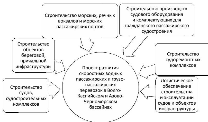
Рис. 4. Отраслевые сегменты бизнеса SRP проекта

Каждый из этапов – сложнейшая многокритериальная задача с огромным количеством показателей, ограничений и неоднозначностью их интерпретации (рис. 5).