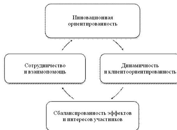
Рис. 2. Подходы к управлению SRP проектами

тативность любой социально-экономической системы в долгосрочном периоде. Таким образом, цепочка методологических подходов для проектов SRP может быть представлена на рис. 2.