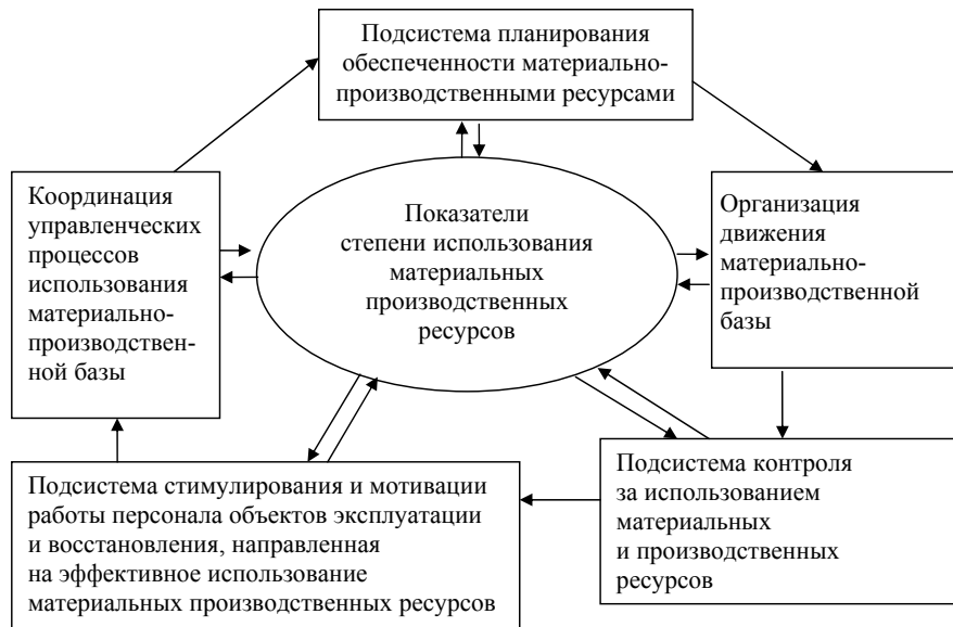
Рис. 3. Элементы системы управления материально-производственными ресурсами объектов эксплуатации и восстановления авиационной техники