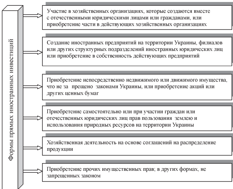
Рис. 1. Формы прямых иностранных инвестиций

Иностранный инвестор принимает решение о целесообразности инвестирования объекта (объектов) в определенной стране. Для этого он должен располагать информацией о степени привлекательности вложений капитала, а также о возможных видах и формах иностранных инвестиций в данной конкретной стране. Основные признаки, которыми обычно пользуются для оценки степени привлекательности инвестирования, показаны на рис. 2.