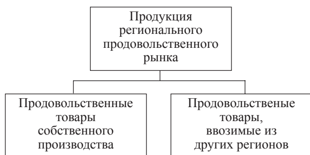
Рис. 3. Состав продукции регионального продовольственного рынка

Несмотря на достаточно полное определение, недостатком данного подхода, на наш взгляд, является то, что продукция регионального продовольственного рынка включает в себя не только товары собственного производства, но и продукцию, ввозимую из других регионов (рис. 3).