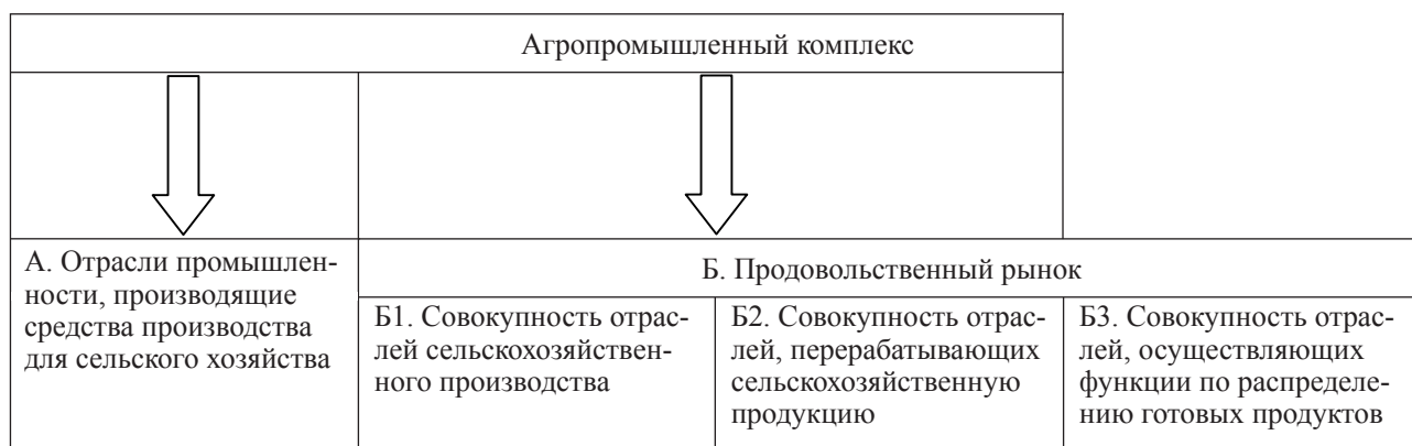
Рис. 2. Модель соотношения АПК и продовольственного рынка

данным определением в связи с тем, что продукция продовольственного рынка идет не только на удовлетворение личных потребностей населения, но и на другие цели (например, корм скоту). Кроме того, в данном определении не рассмотрены субъекты продовольственного рынка.