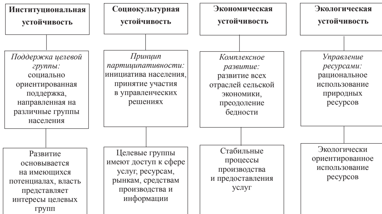
Рис. 2. Составляющие концепции регионального сельского развития