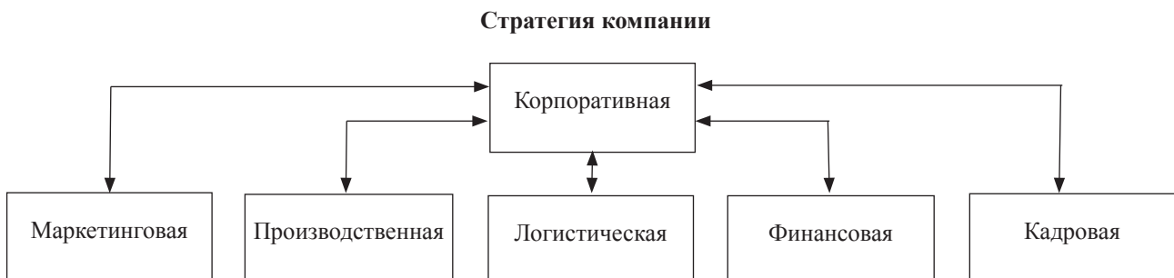
Рис. 2. Взаимосвязи между стратегиями внутри компании

Казалось бы, логистическая стратегия должна быть таким же естественным элементом стратегического планирования бизнеса, как маркетинговая, финансовая, производственная и другие виды стратегии (см. рис. 2). Однако это далеко не так. Чаще всего у средних и небольших российских компаний отсутствует не только логистическая или любая другая стратегия, но и вообще концепция развития бизнеса компании хотя бы на несколько лет. Имеются только планы по открытию новых торговых точек в текущем или следующем году и примерное соображение о том, где хранить товары, которыми будут снабжаться эти точки. Анализ товародвижения в этих компаниях не проводится, и говорить об эффективности управления товарным движением не приходится.