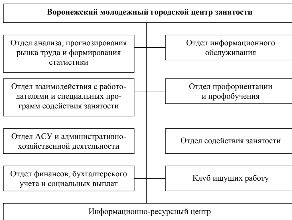
Рис. 2. Организационная структура Воронежского молодежного городского центра занятости

ройства. Отличительная особенность его организационной структуры от других центров занятости состоит в расширении звеньев, оказывающих наибольший эффект на трудоустройство данной категории населения. Создание центра позволило выделить молодежный поток из общего числа обращающихся в службу занятости, внедрить специальные технологии и методики, рассчитанные именно на молодежь, повысить качество работы с ней на основе профилирования по группам – школьники, студенты, выпускники учебных заведений, высвобожденные работники, а также по показателям конкурентоспособности и трудовых мотиваций. Не менее важен и психологический аспект, заключающийся в предупреждении