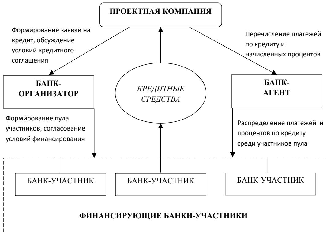
Рис. 2. Схема совместного проектного финансирования с помощью банковского пула

Вторая форма ПФ с совместным финансированием – это параллельное финансирование , которое предполагает независимые отношения проектной компании с каждым из участвующих коммерческих банков. Предполагается, что инициаторы проекта сформируют собственную рабочую группу, которая будет осуществлять переговоры с каждым кредитором и обслуживать в дальнейшем его платежи. В этом случае также достигается возможность реализации крупных проектов ввиду того, что каждый банк может предоставить средства, исходя из собственных кредитных лимитов и финансовых ресурсов. Схема данного вида ПФ представлена на рис. 3.