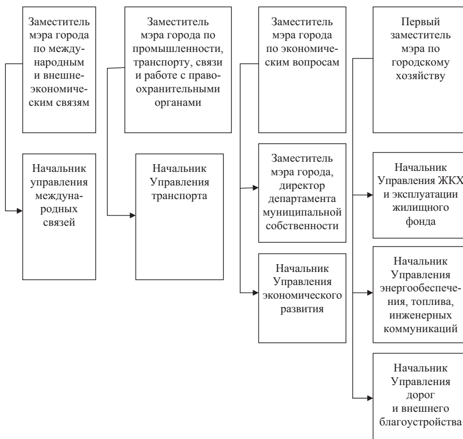
Рис. 2. Соподчиненность руководителей, отвечающих за реализацию одинаковых задач