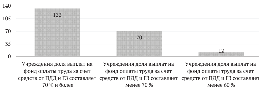
Рис. 2. Доля выплат на фонд оплаты труда за счет средств от ПДД и ГЗ в расходах вузов, представленных в рейтинге качества финансового менеджмента, ед.

Считаем, что целесообразно выделять кадровые показатели в отдельный аналитический блок в рамках анализа экономической безопасности вуза как одно из направлений оценки уровня экономической безопасности учреждений высшего образования. При этом целесообразно осуществлять анализ произ-