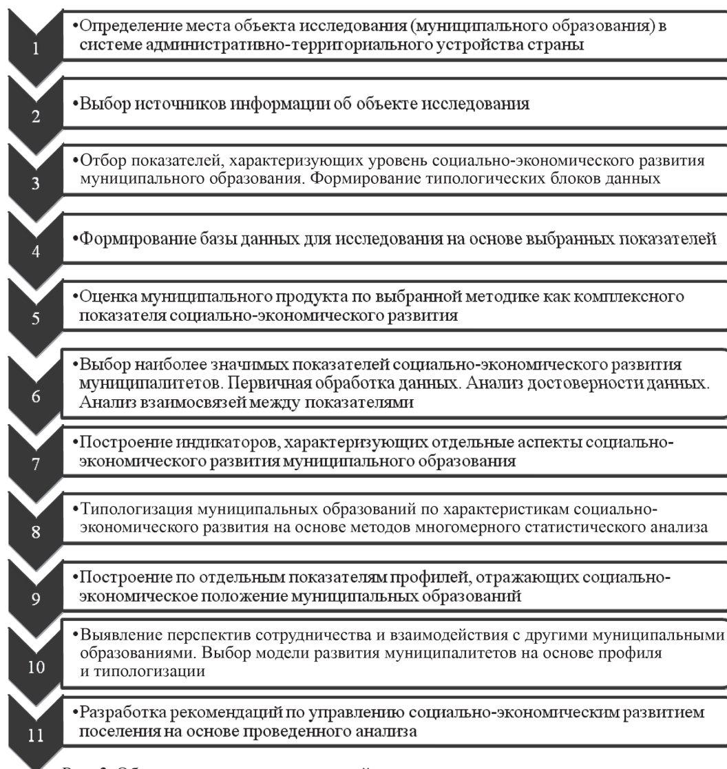
Рис. 2. Общая схема анализа поселений на основе комплексного использования баз данных региональной и муниципальной статистики