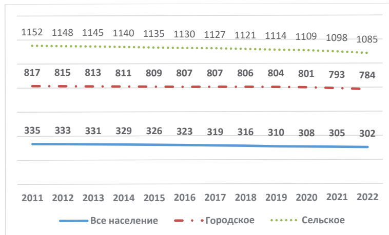
Рис. 1. Население Рязанской области с 2011 по 2022 годы, тыс. человек (построен авторами по [2,16]) [Fig. 1. Population in the Ryazan region from 2011 to 2022, thousand people (constructed by the authors according to [2,16])]

Также в области ежегодно сокращается и доля сельского населения [15]: если в 2010 году было 29,1%, то в 2020 году – 27,8%. Соответственно растет доля городского населения: с 70,9% в 2010 году до 72,2% в 2020 году, то есть рост на 1,3%. В 2022 году численность сельского населения, где пандемия меньше повлияла на обычную динамику, составила по данным базы данных муниципальных образований РФ в регионе 301638 человек. При этом городское население значительно уменьшилась – до 783514 человек, что обусловило и большое уменьшение всего населения региона – 1085152 человек (по данным Росстата – 1083834 человек). При общей убыли жителей региона за 2011-2021 годы на 5,8%, сокращение сельского населения составило – 9,9%, городского – 4%. Более высокие темпы снижения численности сельских жителей обусловили относительную урбанизацию региона за эти годы.