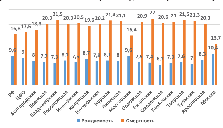
Рис. 3. Коэффициенты смертности и рождаемости в 2021 году, % (построен авторами по [16]) [Fig. 3. Mortality and fertility rates in 2021, % (constructed by the authors according to [16])]

является многолетняя тенденция относительного ухудшения развития населения региона. В 2010 году общий коэффициент рождаемости в Рязанской области составлял 10,2‰ (или 81,6% от общероссийского коэффициента 12,5‰), а в 2020 году он понизился до 7,9‰ (или 80,6% от общероссийского коэффициента 9,8‰). В 2021 году он упал еще больше – 7,4‰ (77,1% от РФ), в РФ 9,6‰. Для сравнения в Чеченской республике он составил 20,1‰ (лучший показатель в РФ), Республике Мордовия – 6,8‰ (худший показатель в РФ). В Центральном федеральном округе (ЦФО) коэффициент рождаемости не изменился (9,0‰ в 2021 году) за счет города Москвы (рис. 3).