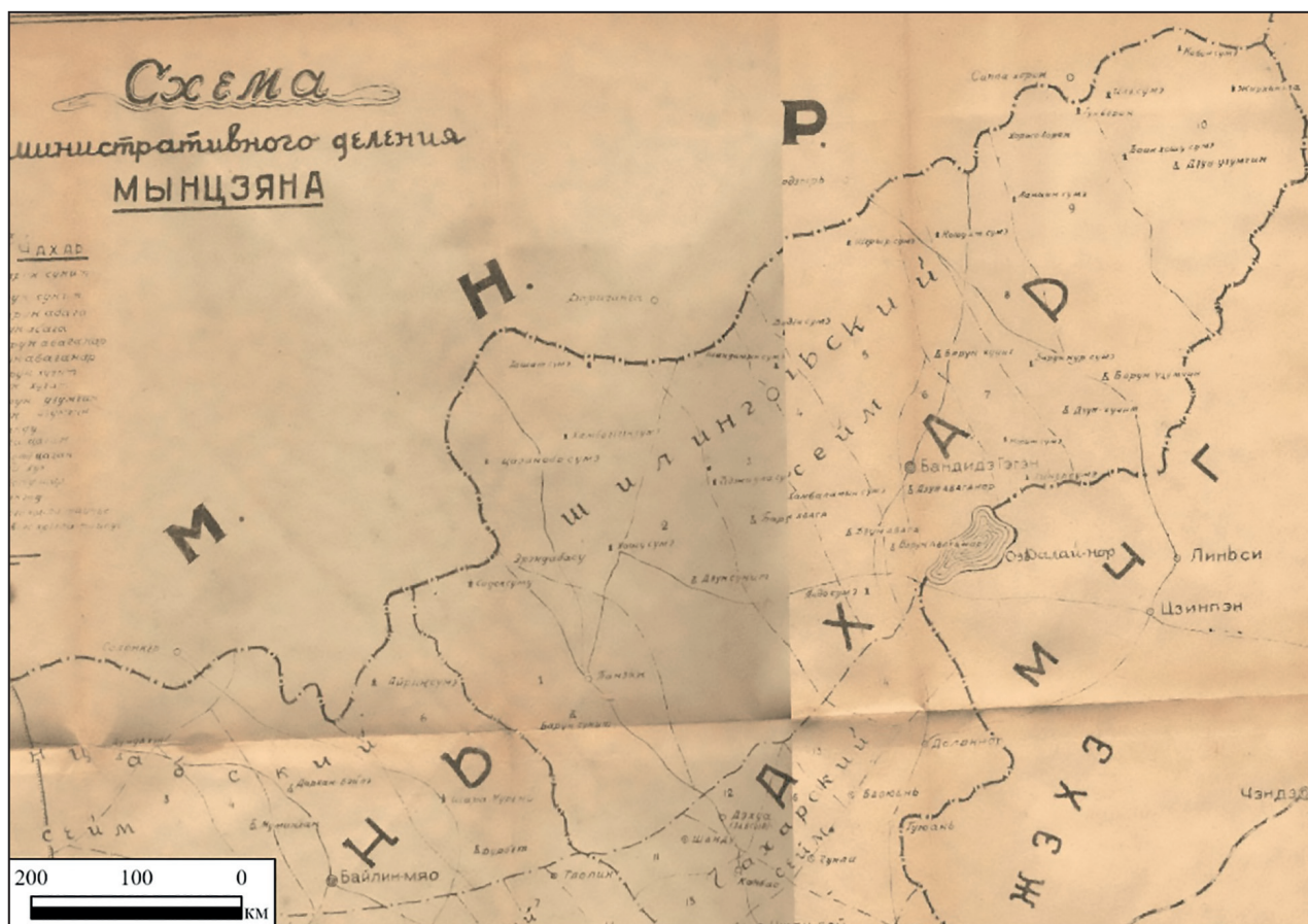
Рис. 2. Шилин-Гол на схеме административного деления Мынцзяна, 1944 г.

Исследование административно-территориального устройства национальных регионов КНР на примере Шилин-Гола в первой половине XX в. продемонстрировало сложный и многоаспектный процесс трансформации традиционной монгольской системы управления в условиях меняющейся политической обстановки. Выбранный нами хронологический отрезок времени – период, насыщенный политическими событиями глобального характера, которые оказали воздействие не только на северо-восточный сегмент Восточной Азии, но и на весь Азиатский континент. Значимость полученных данных в том, что затрагиваемые в насто-