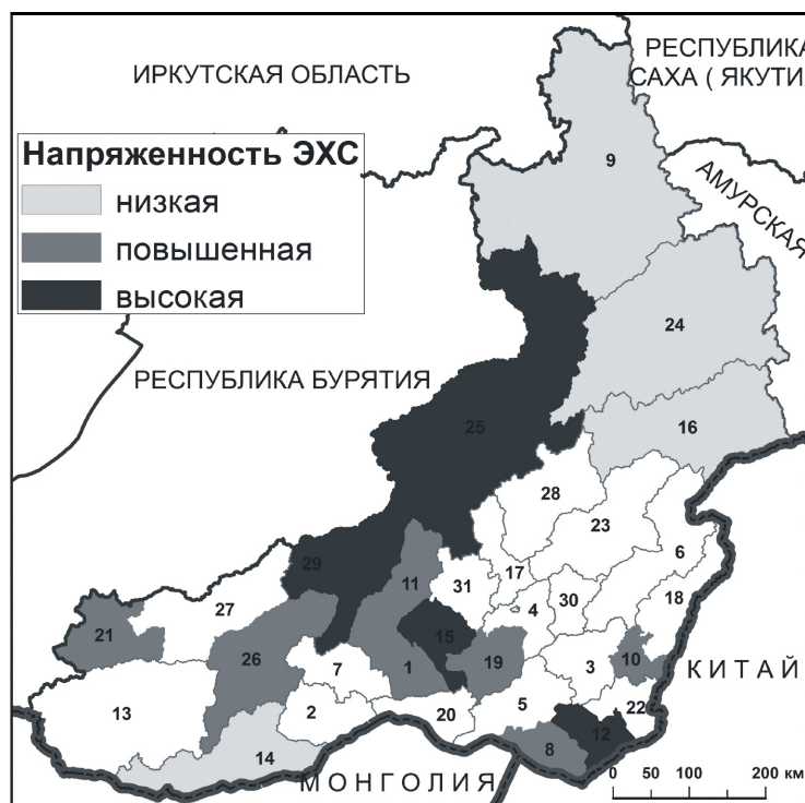
Рис. 4. Кластеризация районов Забайкальского края по напряженности эколого-хозяйственной ситуации

ки) и линейными (добыча россыпного золота) объектами.