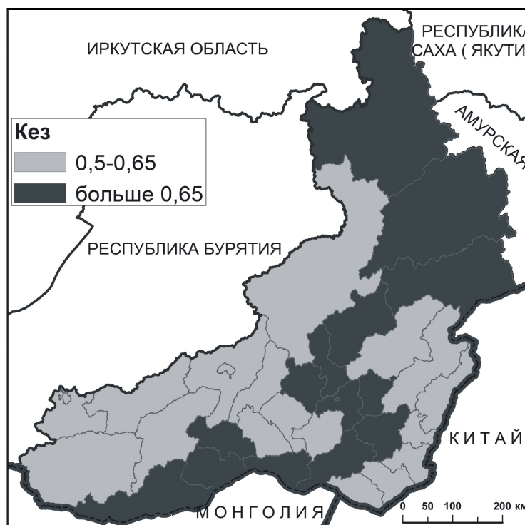
Рис. 3. Распределение коэффициента естественной защищенности ( K_{EZ} ) по районам Забайкальского края

больше защищенность, т.е. устойчивость. Если для территории значение K_{EZ} < 0,5 , то это говорит о том, что она значительно перегружена хозяйственной деятельностью, а чем выше значение, тем выше защищенность и, соответственно, устойчивость территории [10]. Анализ результатов расчета и пространственное распределение этого показателя для Забайкальского края иллюстрируют довольно благополучную картину: ни в одном районе значения K_{EZ} не опускаются ниже 0,5, по краю в целом его значение составляет 0,647 (таблица 2, рис. 3). В целом для всей территории края по предложенному авторами критерию наблюдается благополучная ситуация. Ориентируясь на предложенный показатель, районы края были разбиты на две группы – с повышенной экологической защищенностью и высокой. Наиболее благополучные показатели K_{EZ} в Каларском, Александрово-Заводском районах. Близким к критическим значениям показатель K_{EZ} в Читинском, Могойтуйском и Тунгокоченском районах.