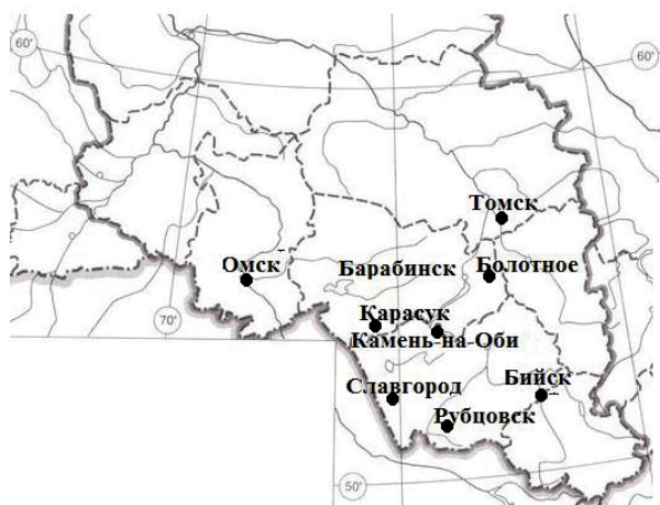
Рис. 1. Метеорологические станции юго-востока Западной Сибири [Fig. 1. Meteorological stations in the south-east of Western Siberia]

для него характерен континентальный климат умеренных широт. Открытость территории на севере и юге способствует свободному проникновению холодных арктических и прогретых континентальных умеренных воздушных масс.