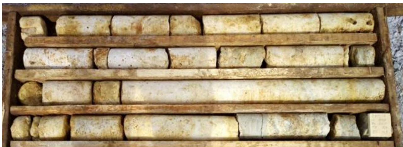
Рис. 2. Карбонатные породы удачинской свиты с интервалами кавернозных коллекторов. [Fig. 2. Carbonate rocks of the Udachnaya formation with intervals of cavernous reservoirs.]

Верхняя подсвита сложена преимущественно карбонатными (известняки и доломиты) породами, с подчинёнными прослоями терригенно-карбонатных разностей (рис. 2). Мощность подсвиты составляет от 220 до 300 м.