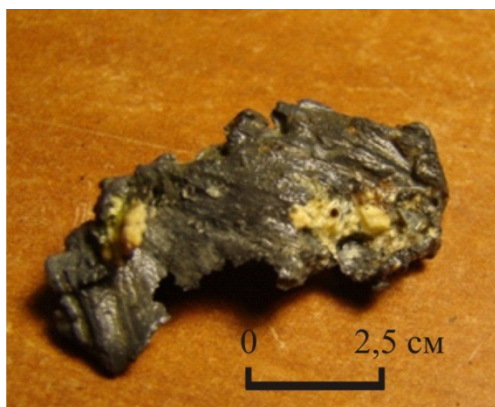
Рис. 4. Самородный свинец из окремнённой породы.