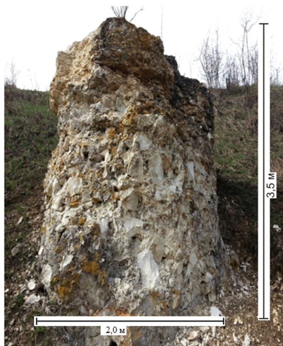
Рис. 2. Проявление столбчатого окремнения («дива») у с. Костенки.

от одного до 10 мм (рис. 3). При зачистке их ножом проявляется блестящая поверхность с металлическим блеском. В целом пятна представлены мягким металлом. Кроме них в окремнённых обломках встречаются редкие, размером до 5 см, выделения уплощенной формы того же металла (рис. 4).