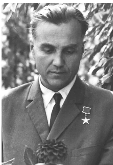
В. А. Сухомлинский, 1968 г.

2023 г. – год 105-летия со дня рождения советского педагога-новатора, публициста, учителя Василия Александровича Сухомлинского (1918–1970) 3 . Педагогическая система В. А. Су-