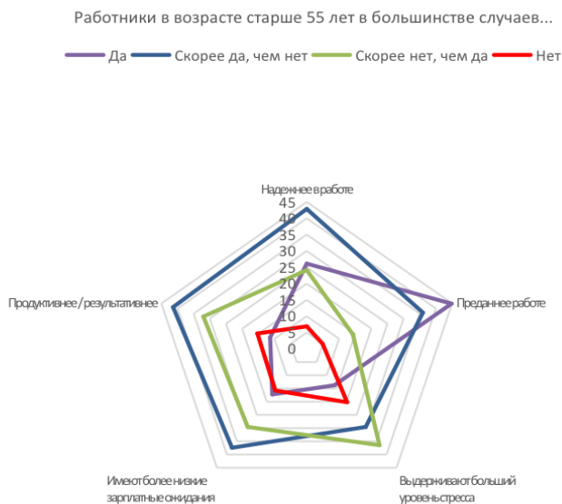
Рис. 2. Лояльность и преданность организации возрастного персонала

Высоко оценена также лояльность пожилых работников к организации, в которой они заняты. Квадранты с сосредоточением мнений опрошенных о неготовности возрастного персонала долго работать и его нелояльности по отношению к работодателю оказались практически пустыми (рис. 2).