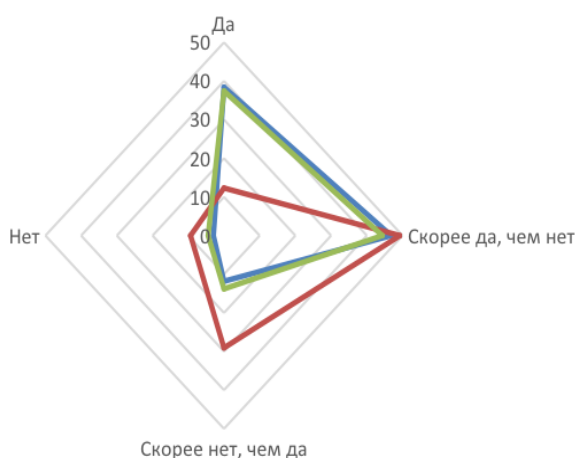
Рис. 4. Оценка респондентами причин абсентеизма у работников старших возрастов

— Пример для других — Лучше работают в команде — Лучше работают самостоятельно