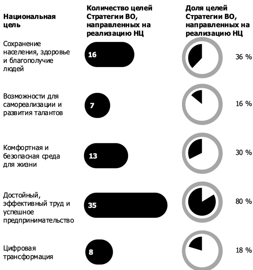
Рис. 5. Характеристика интеграции НЦ в Стратегию Воронежской области

Национальные цели развития РФ также интегрированы в Стратегию Воронежской области. Характеристика интеграции НЦ в Стратегию Воронежской области приведена на рисунке 5.