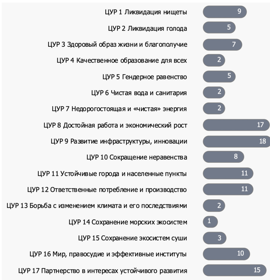
Рис. 3. Количество ГП Воронежской области, направленных на реализацию каждой из ЦУР

Например, на реализацию ЦУР 3 «Здоровый образ жизни» направлено 9 целей и 21 показатель Стратегии Воронежской области. Из целей – это, например, цель 1.1. «Повышение уровня рождаемости, рост численности постоянного населения Воронежской области», цель 1.2. «Рост ожидаемой продолжительности жизни населения и снижение преждевременной смертности», цель 1.9. «Формирование доступной среды для инвалидов и иных маломобильных групп населения», цель 1.11. «Улучшение экологических условий жизнедеятельности населения», цель 1.14. «Развитие индустрии отдыха, спорта и досуга» и ряд других.