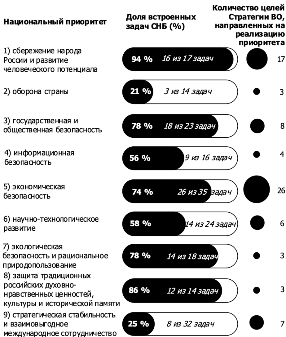
Рис. 4. Характеристика интеграции СНБ в Стратегию Воронежской области

Встроенность задач СНБ в Стратегию Воронежской области в разрезе каждого приоритета СНБ составляет от 21% до 94%. Широкий диапазон встроенности объясняется различным количеством задач стратегических приоритетов СНБ, решение которых направлено на реализацию полномочий федерального уровня. Все цели Стратегии Воронежской области ориентированы на реализацию положений СНБ. Характеристика интеграции СНБ в Стратегию Воронежской области приведена на рисунке 4.