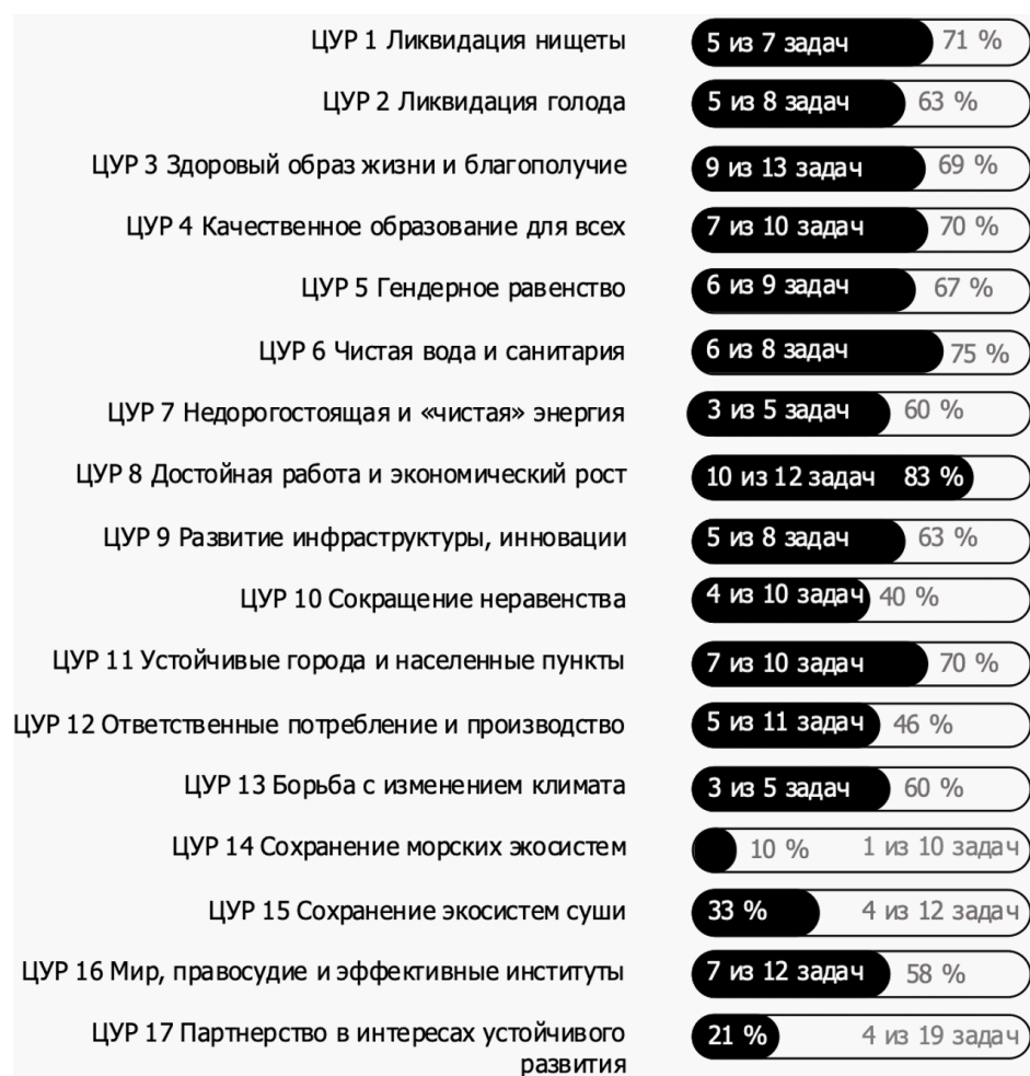
Рис. 1. Интеграция задач ЦУР в стратегические документы Воронежской области в разрезе каждой ЦУР

Встроенность задач ЦУР в стратегические документы региона в разрезе каждой ЦУР составляет от 10 до 83% (рис. 1).