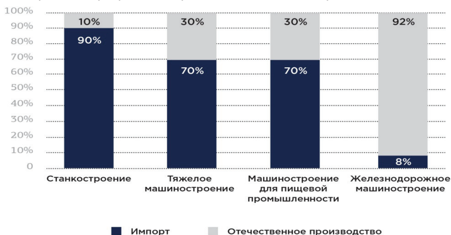
Рис. 3. Доля импорта и отечественного производства в основных категориях машиностроения 5

На рис. 3 представлена структура ключевых отраслей российского машиностроения в разрезе импорта и отечественного производства.