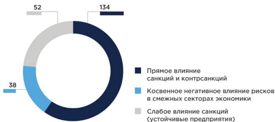
Рис. 2. Распределение градообразующих организаций по уровню рисков, обусловленных введением санкций (по итогам геополитических изменений с февраля по июнь 2022 года) 4

Ключевым показателем влияния санкций на экономику государства является количество градообразующих предприятий, которые попали под санкции, а главное – уровень влияния введенных санкционных пакетов на эти организации. На рис. 2 представлено систематизированное представление данных, опубликованных Министерством промышленности и торговли Российской Федерации. Самая большая угроза стоит перед моногородами, основной целью функционирования которых было производство продукции для экспорта в страны Евросоюза. Введенные санкционные ограничения наиболее сильно повлияли на такие отрасли экономики государства, как металлургия, транспортное машиностроение, лесная промышленность, деревообработка [5, 6].