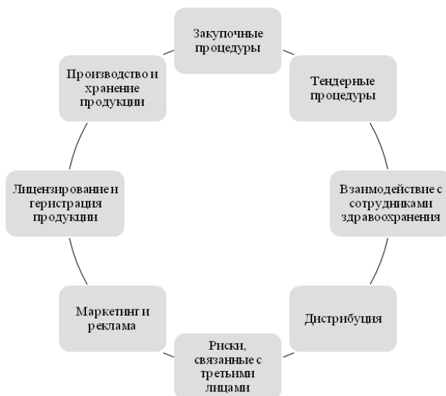
Рис. 2. Области коррупционных рисков на рынке фармацевтики

По результатам исследования выявлены области повышенного коррупционного риска, изображенного на рисунке 2.