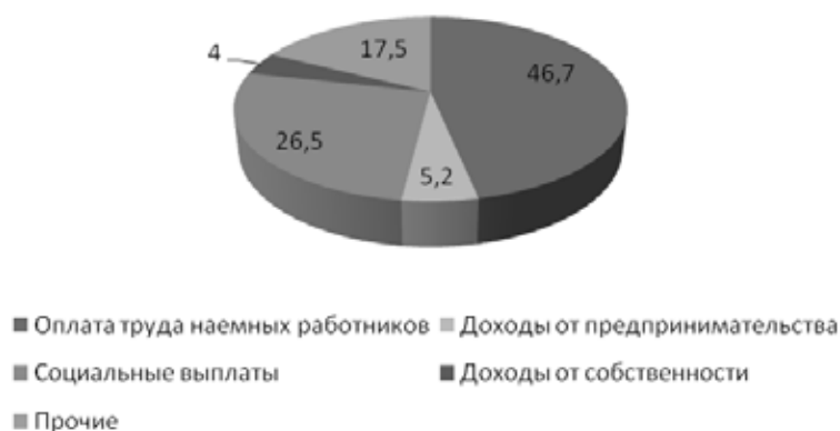
Рис. 1. Структура доходов населения по их источникам (2021 год)

За рассматриваемый период среднедушевые доходы населения области выросли на четверть, однако их покупательная способность колебалась по годам и не всегда номинальный рост покрывал инфляцию. Зарплата выросла почти на 40%. Следует подчеркнуть, что соотношение среднедушевых доходов с величиной прожиточного минимума устойчиво росло, однако до сих пор далеко еще не достигло рекомендуемого минимума в 300%.