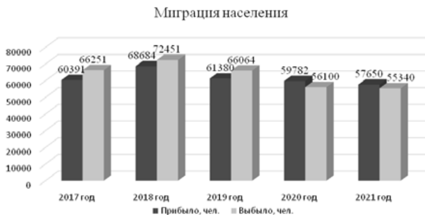
Рис. 2. Динамика миграционных потоков в Волгоградской области

Динамика миграционных потоков в Волгоградской области представлена на рисунке 2.