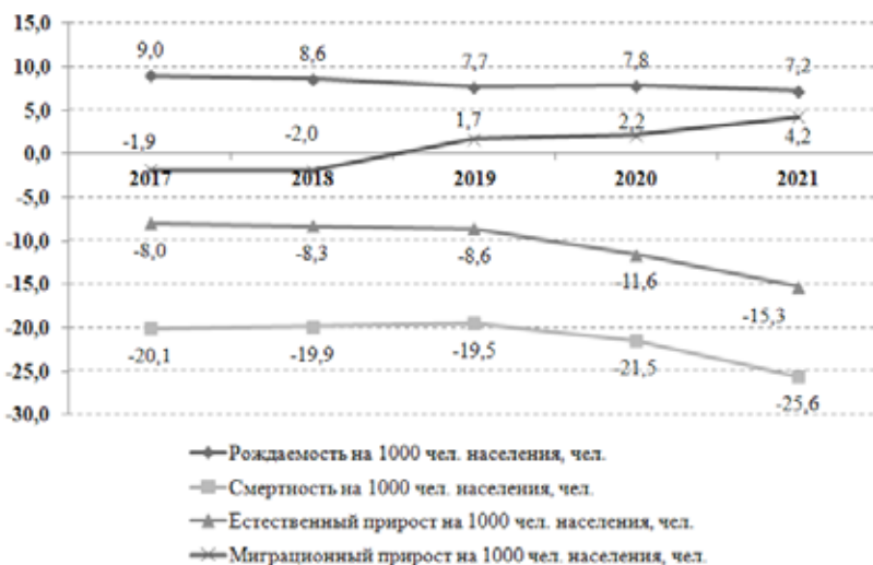
Рис. 1. Социально-демографические характеристики сельского населения Липецкой области за 2017-2021 гг.

Рассматривая подробнее миграционный прирост на сельских территориях за исследуемые годы (рис. 2), можно отметить, что регион стал центром притяжения, в первую очередь, для трудоспособного населения, что связано с множеством инновационных и инвестиционных проектов, реализуемых в муниципальных районах Липецкой области, включая создание особых экономических зон.