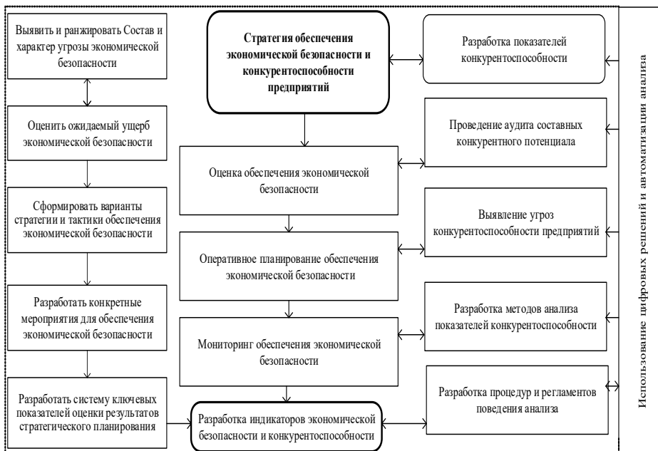
Рис. 2. Этапы разработки стратегии обеспечения экономической безопасности и конкурентоспособности предприятий

Конкурентоспособность предприятий невозможна вне понимания конкуренции, которая оказывает сильное воздействие на бизнес [7], поскольку формирует конкурентную среду. Существует несколько методологических подходов к оценке конкурентоспособности предприятий [8, 9]: