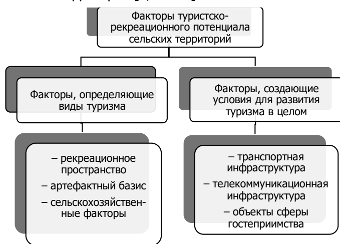
Рис. 4. Классификация факторов туристско-рекреационного потенциала сельских территорий

Авторы исследования полагают, что развитие сельского туризма не может быть основано только на внешних факторах, которыми являются государственная поддержка и льготное финансирование. Помощь от государства эффективна только в том случае, если задействованы внутренние резервы предприятий [11, с. 21]. Речь должна идти о системном развитии сельских территорий и сельскохозяйственной отрасли в целом. В предыдущих работах авторами определены факторы туристско-рекреационного потенциала сельской территории [1, с. 125].