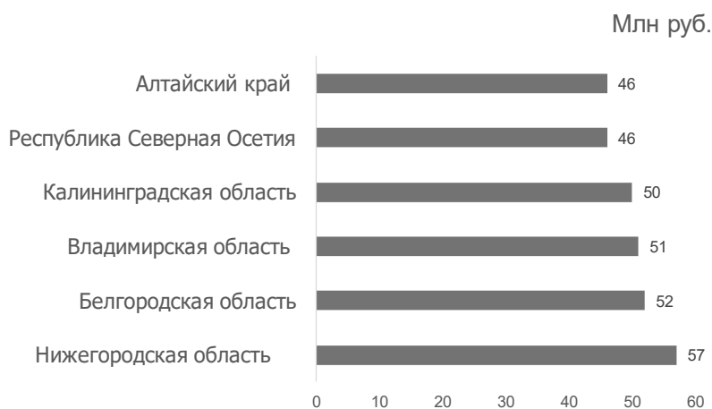
Рис. 3. Получатели субсидий по программе «Агротуризм» за период 2022-2024 годы (в млн руб.)

Так как программа «Развитие туризма» существует менее 2-х лет, она еще не успела получить широкое информационное освещение среди предпринимателей, занятых в сфере сельского туризма. Соответственно, чем большее распространение в СМИ получит эта программа, тем больше предпринимателей смогут воспользоваться ею.