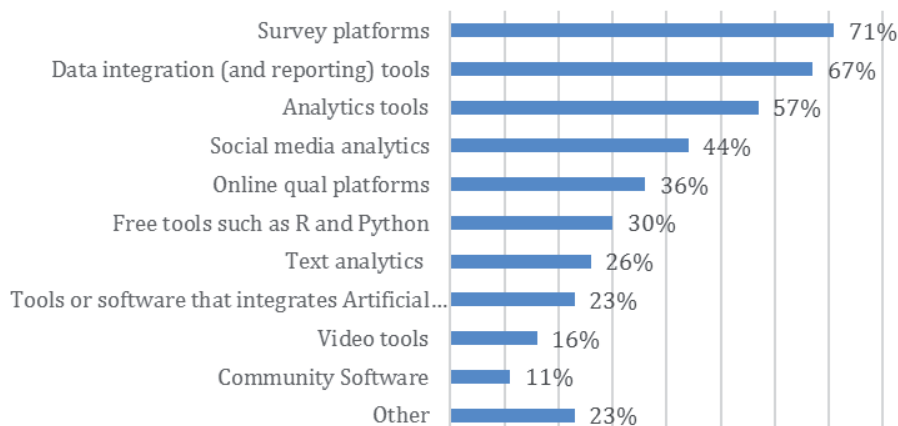
Рис. 2. Востребованность сервисов и инструментов аналитики

правлений развития, рекомендаций, понимания запросов клиентов и т.д., компании-заказчики обращаются к профессиональным агентствам. В связи с этими выявленными тенденциями можно отметить, что меняются и формы взаимоотношений между исследовательской компанией и клиентом. Для эффективного достижения поставленных задач и консультирования компании-клиента организации взаимодействуют как партнеры, поскольку важно глубокое понимание проблем и запросов клиентов, учет конкретных ситуаций и ограничений. Данный тезис поддерживают почти 20% всех респондентов.