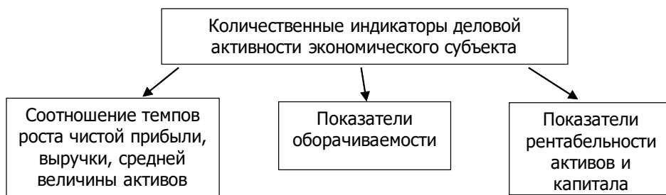
Рис. 1. Количественные индикаторы оценки деловой активности

Деловую активность можно представить в виде системы количественных и качественных индикаторов. Количественные индикаторы деловой активности раскрыты на рис. 1.