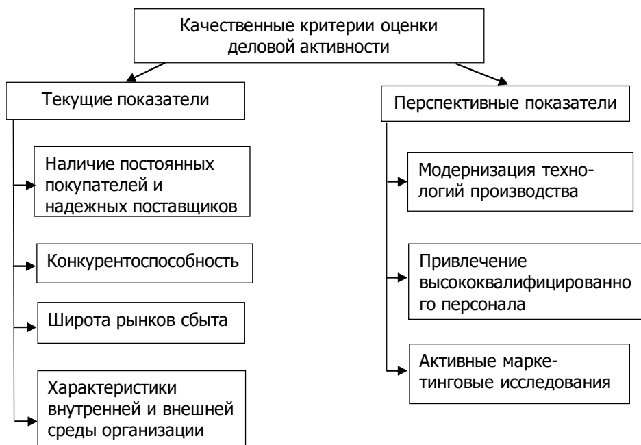
Рис. 2. Состав качественных показателей деловой активности

Качественные индикаторы оценки деловой активности отражают широту рынков сбыта, конкурентоспособность, деловую репутацию и эффективность менеджмента. Качественные индикаторы деловой активности представлены на рис. 2.