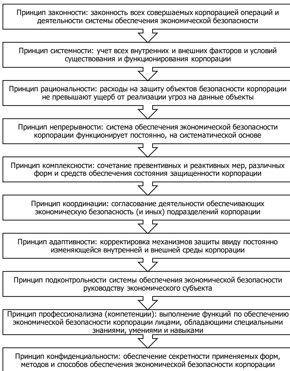
Рис. 1. Основные принципы формирования и функционирования системы обеспечения экономической безопасности корпорации

Проведенный обзор научной и учебно-методической литературы позволил выделить цель системы обеспечения экономической безопасности корпорации, заключающейся в минимизации и устранении потенциальных и реальных угроз жизненно важным интересам корпорации посредством эффективного использования корпоративных ресурсов и осуществления специальных механизмов, а также ряд задач такой системы (см. рис. 2).