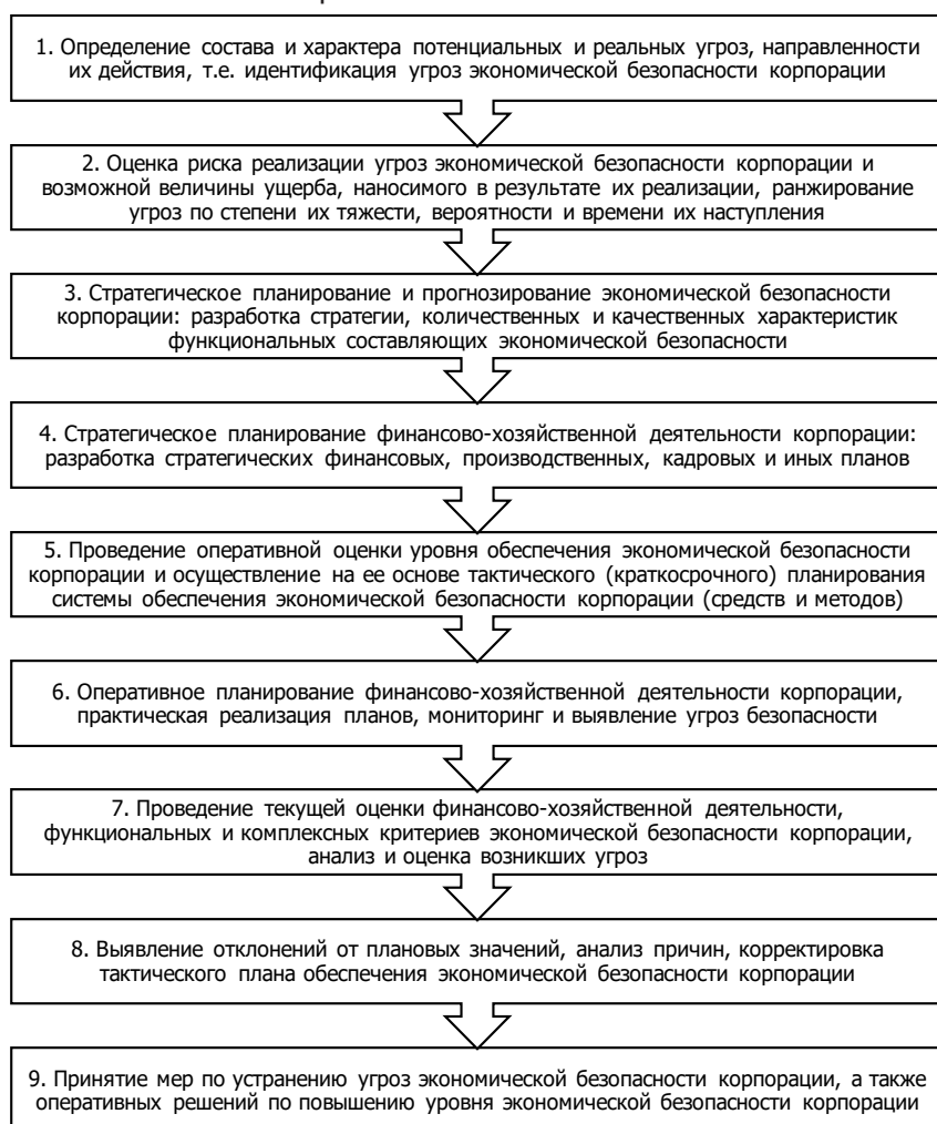
Рис. 5. Алгоритм обеспечения экономической безопасности корпорации

Таким образом, система обеспечения экономической безопасности представляет собой единую, целостную совокупность, включающую в себя взаимосвязанные и взаимообусловленные элементы (объекты, субъекты и специальные механизмы), комплексное функционирование которых направлено на идентификацию рисков и угроз жизненно важным интересам экономического субъекта, а также разработку и реализацию превентивных и реактивных мер по их предотвращению и минимизации, что обеспечивает условия для стабильного и устойчивого функционирования и развития экономической системы в целом, реализации ее стратегических целей и наделяет экономический субъект конкурентными преимуществами для систематического извлечения прибыли.