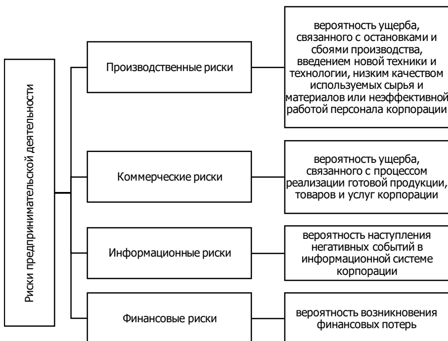
Рис. 2. Классификация рисков предпринимательской деятельности корпорации, выделяемая О.А. Коваленко и др.

Основными причинами возникновения производственных рисков являются: