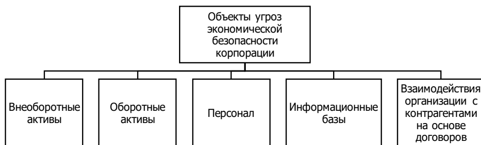
Рис. 1. Объекты угроз экономической безопасности корпорации

Касательно объектов, то они представляются элементами и процессами корпоративной системы, жизненно важными интересами и ресурсами организации (корпорации), подверженными негативному (деструктивному) воздействию со стороны субъектов (носителей) угроз. И.А. Сергеева, А.Ю. Сергеев выделяют представленные на рисунке 1 объекты угроз экономической безопасности корпорации в качестве основных.