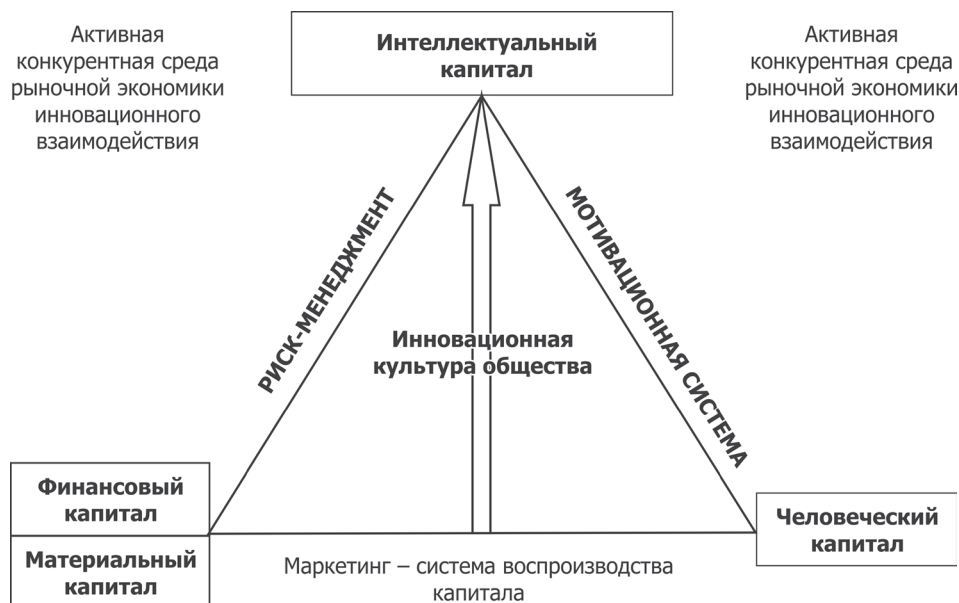
тивной и организационной культурой бизнес-структур. Рис. 2. Роль и место инновационной культуры общества в рыночной экономике инновационного взаимодействия

Беря у природы мало, в простых, непосредственно доступных формах, человечество могло долго существовать и развиваться практически без возмещения взятого у природы. Постепенно накапливается «экономический долг» человека за повышенный эффект природопользования, уже полученный многими поколениями людей, приходится или придется «расплачиваться» их потомкам.